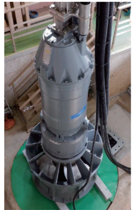
水中タービン発電機 (水中より引き上げた状態)