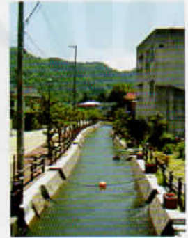
二万石上部水路 (砺波市庄川町地内)