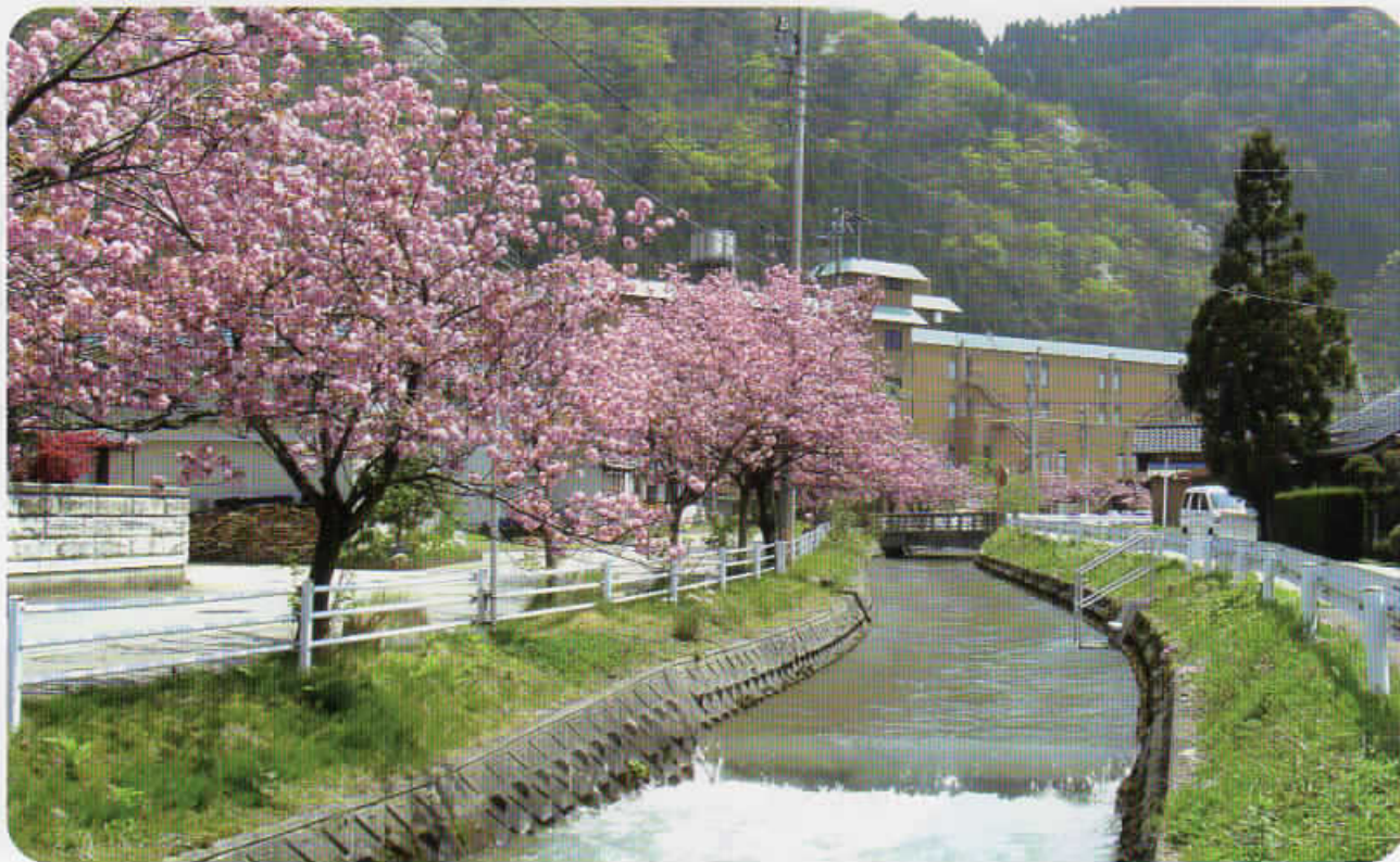
上部用水（砺波市庄川町青島、全屋地内）

発行/庄川上流用水土地改良区 〒939-1521 富山県南砺市苗島 374 番地 4 TEL (0763)22-2373 FAX (0763)22-7433