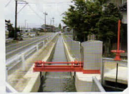
県営基幹水利施設ストックマネジメント事業「庄川地区」

共同揚水機場 遊水池補修工事 共同揚水機場 スクリーン補修工事 (南砺市高瀬地内)