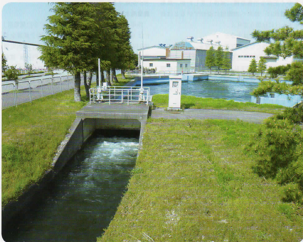
揚水機場から取水する新用水幹線水路(南砺市高瀬地内)

発行/庄川上流用水土地改良区 〒939-1521 富山県南砺市苗島374番地4 TEL(0763)22-2373 FAX(0763)22-7433